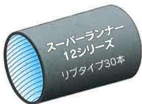
特許取得済み(らせん)

内張りが合わさった時の貼り付きを防止し、空気抜きを容易にし、水の通りをスムーズに