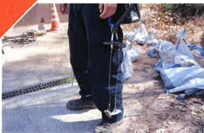
現場へ、斜面上へ運ぶのに一苦勞